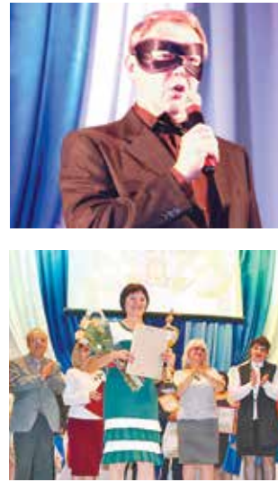
КОНКУРС «СОЛО С ГЛAVOЙ»